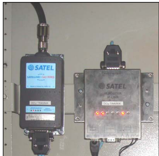
Instalacija Sateline 3AS NMS radijskog modema i IP-LINK uređaja na lokaciji DCU Travnik

Centralni element u kojem je definiran mrežni IP sloj i konfiguracijski parametri preusmjeravanja podatkovnih paketa je IP-LINK modul koji obavlja prilagodbu Ethernet prometa na radijsko sučelje radijskog modema. U njemu su integrirani algoritmi izbjegavanja kolizije podatkovnih paketa na zračnom sučelju te algoritmi sigurnog prijenosa podataka s potvrdom o ispravno primljenom paketu. Osim naprednih routing funkcija temeljenih na IP protokolu, IP-LINK ima pridružene i dodatne funkcionalnosti u vidu AES enkripcije, komprimiranja podataka, firewall itd. U svrhu dodavanja dodatnih serijskih sučelja instalirana je industrijska verzija terminal servera sa 4 serijska sučelja koja se mogu konfigurirati kao RS232, RS422 ili RS485 sučelje.